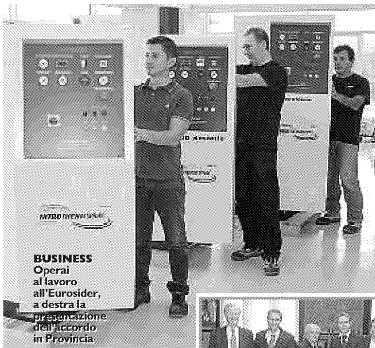
BUSINESS Operai al lavoro all'Eurosider, a destra la presentazione dell'accordo in Provincia